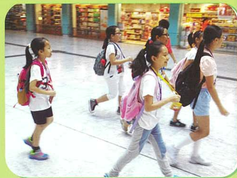
大家快步尋找定向地點，努力啊！