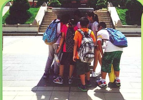
在烈日當空下，同學們非常努力及團結在完成任務