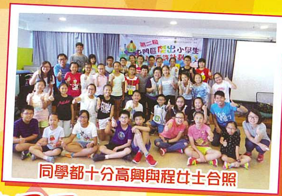
同學都十分高興與程女士合照