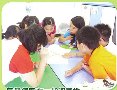
同學們圍在一起認真地商討路線及策略

學生分成5組，透過定向活動促進大家對屯門區認識。同學們一起組織及策劃路線，乘搭不同交通工具，去到市中心、新墟、大興、兆康及嶺南大學等不同位置，進行任務，學生爭取在有限的時間發揮最強的合作精神，落力爭取分數，從中更認識了不少社會設施和社區服務。無論勝負如何，大家都非常享受尋找路線的過程，團結一致，亦為他們裝備日後的社區體驗。