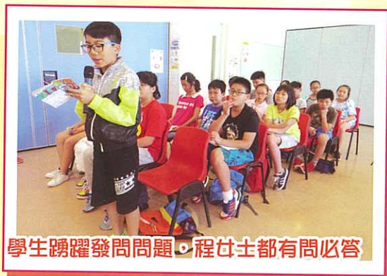
學生踴躍發問問題，程女士都有問必答