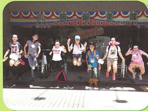
大家在體育館一齊跳起完成任務