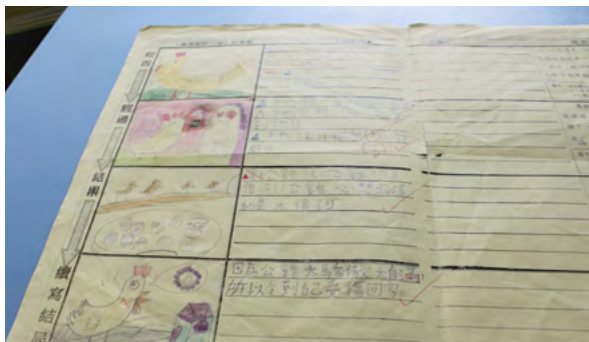
學生先在家裡繪畫與文章相應的畫像，再在課堂中與同學分享。